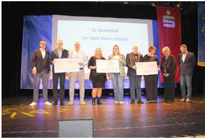
Übergabe der Spenden-Schecks