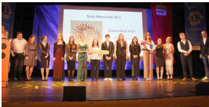
Beste Mannschaft: Drachenboot - Jugend ESV Waren e.V.